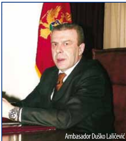
Ambasador Duško Laličević

Ambasada Crne Gore, nakon stvaranja potrebnih uslova za rad i njenim kadrovskim ekipiranjem, obezbjedila potrebne pretpostavke za kvalitetan i uspješan rad, a poseban akcenat je dat unapređivanju političkih odnosa, kao i ekonomskoj saradnji između dvije države. Sama činjenica što između Republike Makedonije i Crne Gore nema otvorenih političkih pitanja, već bilateralni odnosi služe za primer ne samo u regionu nego i šire, bio i ostao podsticaj i dodatni impuls za još kvalitetniji rad. U cilju unapređivanja odnosa, organizovano je više zvaničnih posjeta delegacija iz Crne Gore Republici Makedoniji, i to na najvišem nivou, tako da su Makedoniju u 2007 godini posjetili predsjednik Crne Gore, N.J.E. g-din Filip Vujanović, tadašnji predsjednik Vlade Crne Gore, N.J.E. g-din Željko Šuranović, ministar inostranih poslova N.J.E. g-din Milan Roćen, ministar za ekonomiju, N.J.E. g-din Branimir Gvozdenović ministar poljoprivrede, N.J.E. g-din Milutin Simović i mnoge druge ličnosti iz političkog, kulturnog i javnog života Crne Gore.